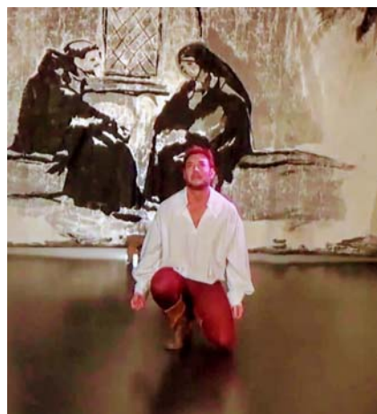
Imágenes de: “Los hábitos de una rebelde “