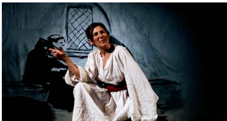
Imágenes de: “Los hábitos de una rebelde “

Sus últimos trabajos teatrales han sido “La Pasión, su último secreto” de Producciones Narea y “Bajarse al moro” con la Kimera Teatro. y ”Dos tricornos y un alma de versos rotos” “Los hábitos de una rebelde” con Azares Teatros.